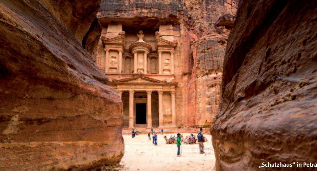
„Schatzhaus“ in Petra

aus byzantinischer Zeit. Vom Berg Nebo blicken wir ins „Gelobte Land“. (ca. 100 km)