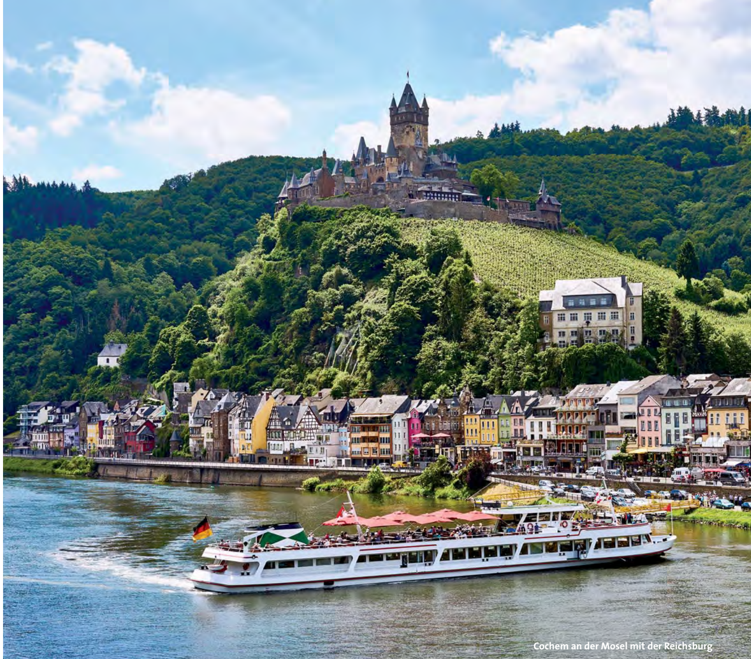
Cochem am der Mosel mit der Reichsburg