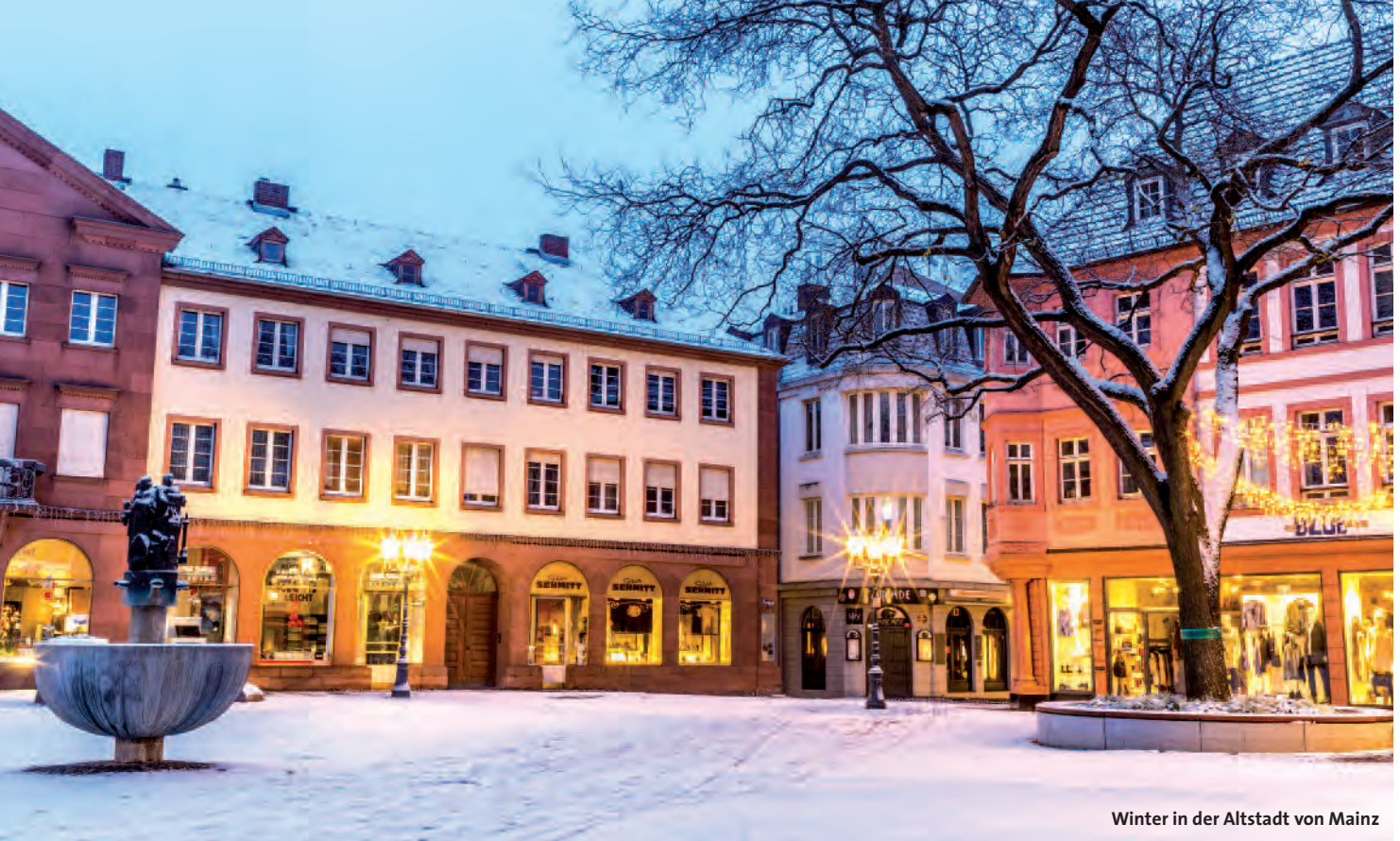
Winter in der Altstadt von Mainz