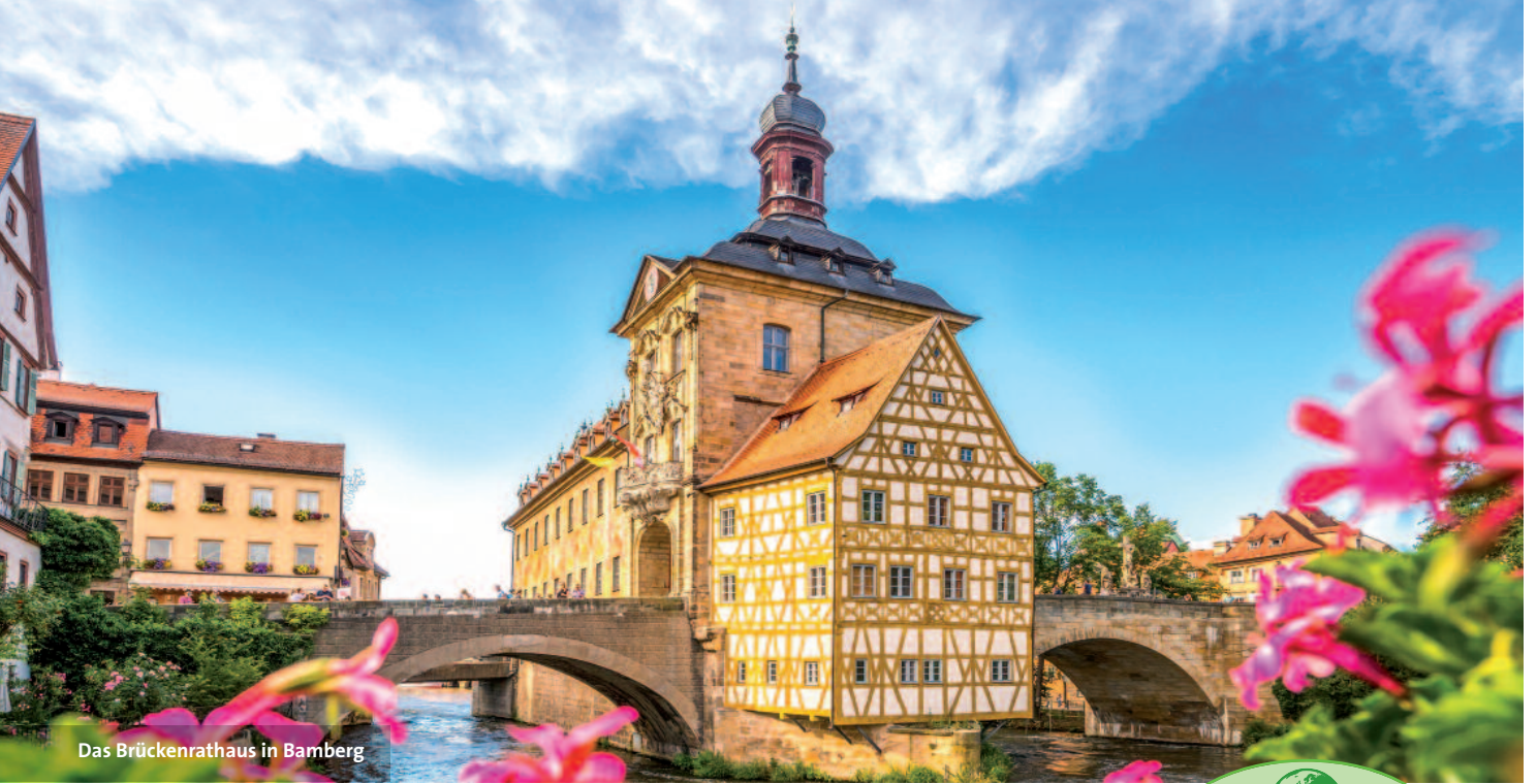
Das Brückenthurm in Bamberg